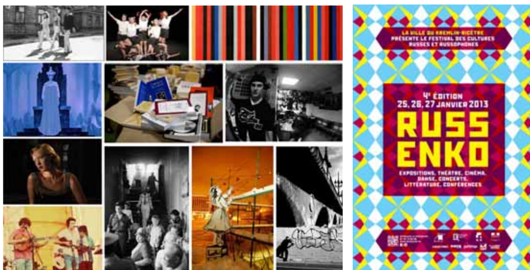
Photo : la première rétrospective en France de l'un des plus talentueux photographes russes actuels, Igor Moukhin. « La Russie d'Igor Moukhin : photographies de 1987 à 2012 » (du 25 janvier au 24 février). Vernissage et visite guidée en présence de l'artiste. Commissaire d'exposition : Christian Gattinoni (LaCritique.org)

Théâtre : Les Jeunes Filles , pièce de théâtre extrait d'une nouvelle de Ludmila Oulitskaïa par la compagnie de Théâtre SamArt.