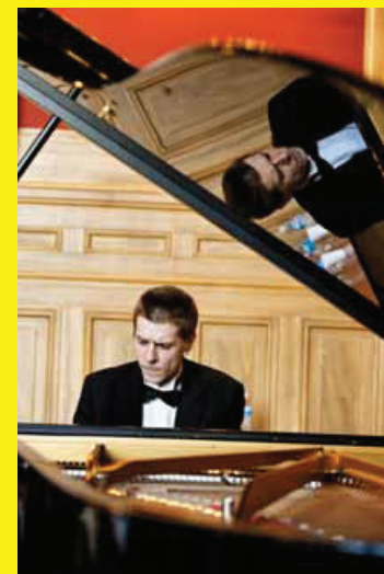
MUSIQUE CLASSIQUE avec les pianistes du concours Vera Lautard-Chevtchenko PAGE 25