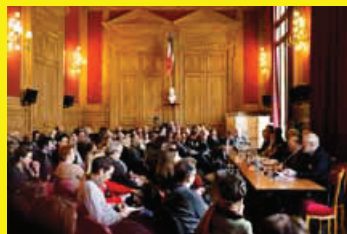
TABLES RONDES PAGES 16, 18 ET 23