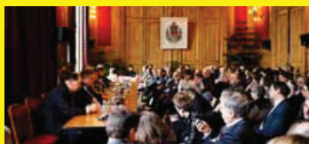
TABLE RONDE FRANCE/RUSSIE 2012 : ÉLECTIONS PRÉSIDENTIELLES CROISÉES

14H-16H SALONS DE L'HÔTEL DE VILLE ACCÈS AVEC PASS