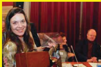
LITTÉRATURE avec le Prix Russophonie • PAGE 19