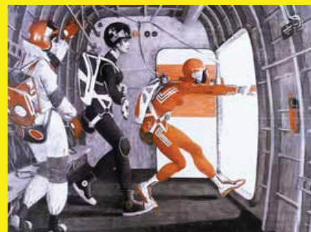
Alexey Kallima, Équipe féminine tchéchène de saut en parachute , 2008