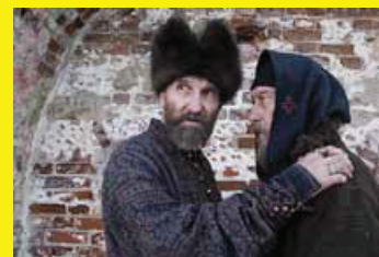
CINÉMA RUSSE DES ANNÉES 2000 avec Tsar de Pavel Lounguine PAGE 20