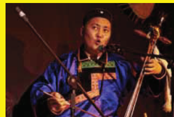
CHANT BOURIATE avec Otkhon • PAGE 17